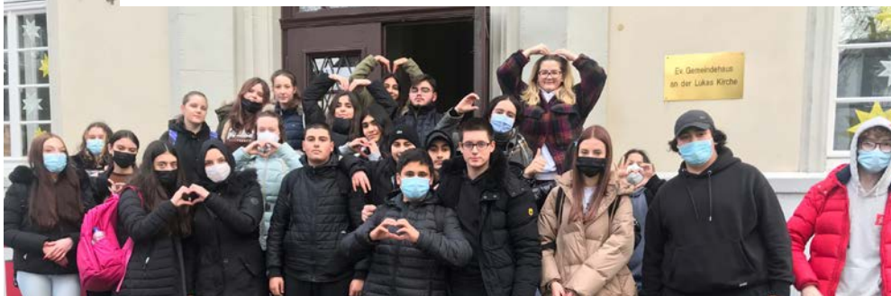
▲ Die Schüler der 9B vor der Lukaskirche in Porz