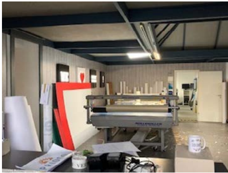
▲ Die Produktionsräume des Ausbildungsbetrieb „werbetechnik kurscheid“ in Deutz.