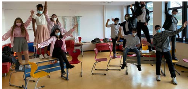
▲ Die Darsteller der Musical AG proben bis zu ihrem Auftritt im Juni 2022

Daumen, dass die Aufführung stattfinden kann. Weitere Informationen zum Stück und den Darsteller*innen findet ihr auf unserer Schulhomepage unter: http://max-planck-realschule-koeln.de/?page_id=743 (KL)